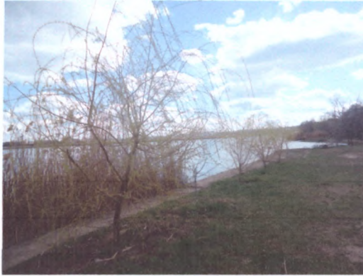
Берегова зона потребує озеленення - початок покладено студентами міста

Ці місця подобаються городянам як влітку, так і взимку, особливо на Водохрещу