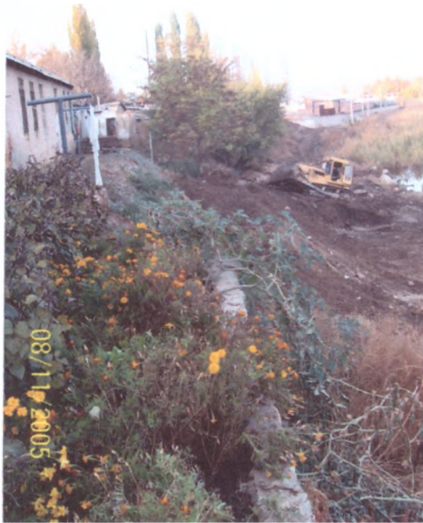
Схема теренкуру «Кільце здоров'я»( загальна протяжність –200 м), Маршрут №1 протяжність – 30 м: Еко-доріжка «зі схилу до берега» з металевими опорами: облаштунки схилу потребують будівельних матеріалів та спеціальної техніки

Примітка: показана схема теренкуру через окремі фотокопії минулих років по благоустрою цієї місцини