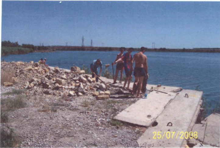
Студенти-аграрники беруть багато років всю важку роботу по благоустрою берега ріки Інгул на себе- це почесна місія молоді нашого мічта

Маршрут №3 - протяжність –30 м Еко-доріжка починається від каплички Св.Миколая,далі іде спуск по сходах (сходи потребують оновлнгтя) і біля панно (робоьа АДТ) повертає направо і проходить по береговій смузі до пам'ятного знаку Офіцерському десанту-визволителям м. Миколаєва