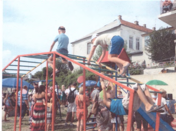
«Рукоход» особливо подобається дітям і молоді

Еко-доріжка №2 може бути використана не тільки як бігова, але і в якості пішохідної для прогулянки з відпочинком на лавах біля річки- для слабких здоров'ям або особами, що мають фізичні вади- в обох випадках вона може мати для них не тільки оздоровчий зарактер, але й змагальний.