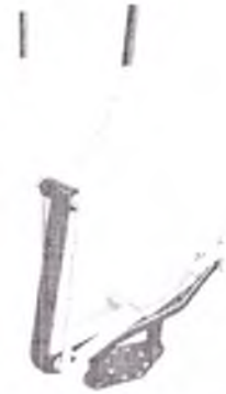
«Розгинач стегна – м'яз черевного пресу» (SG159)