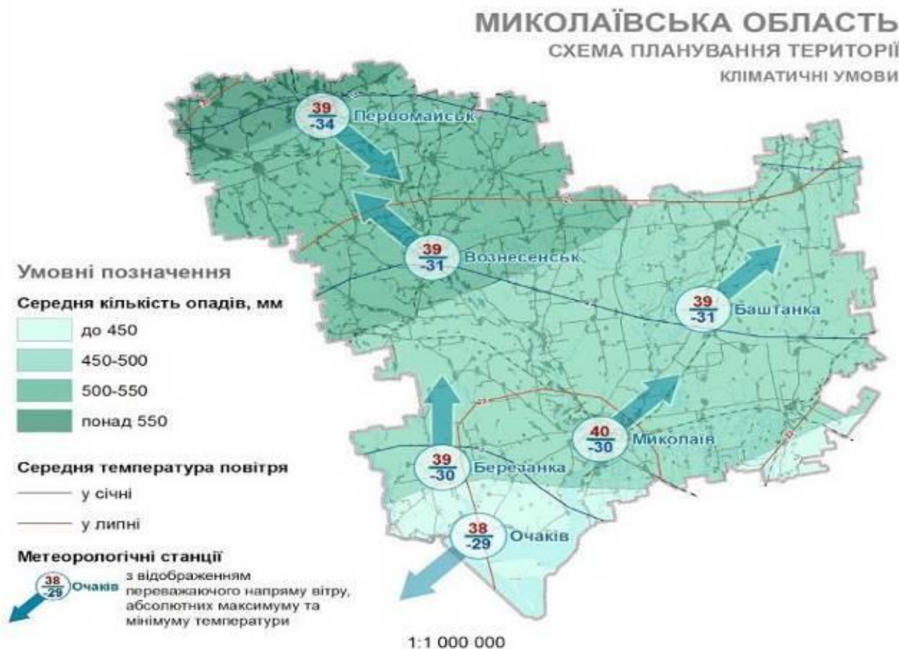
Рисунок 2.3 – Кліматичні умови Миколаївської області Переважаючі напрями вітрів у місті Миколаєві є північно-східні.