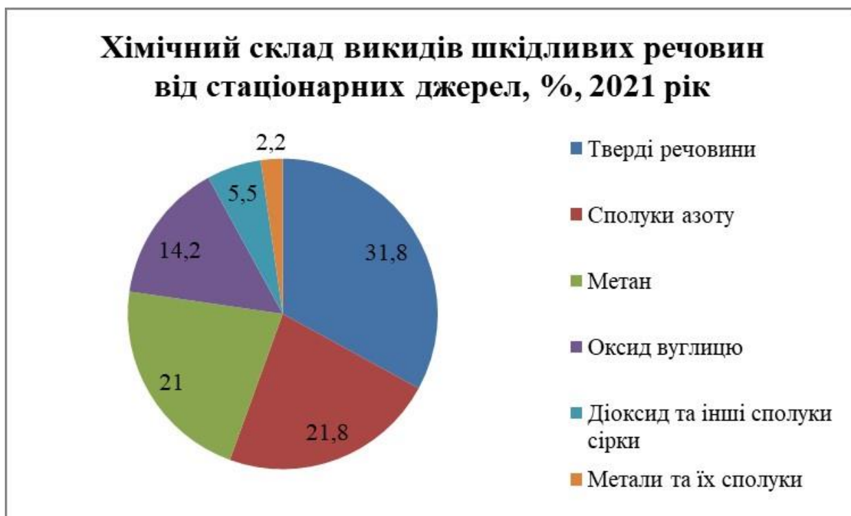
Рисунок 3.1 – Хімічний склад викидів шкідливих речовин від стаціонарних джерел, %, 2021 рік

Згідно зі статистичним бюлетенем «Викиди забруднюючих речовин і парникових газів у атмосферне повітря від стаціонарних джерел викидів у 2021 році» надалі представлені дані про обсяги викидів забруднюючих речовин в атмосферне повітря стаціонарними джерелами викидів по Миколаївській області.