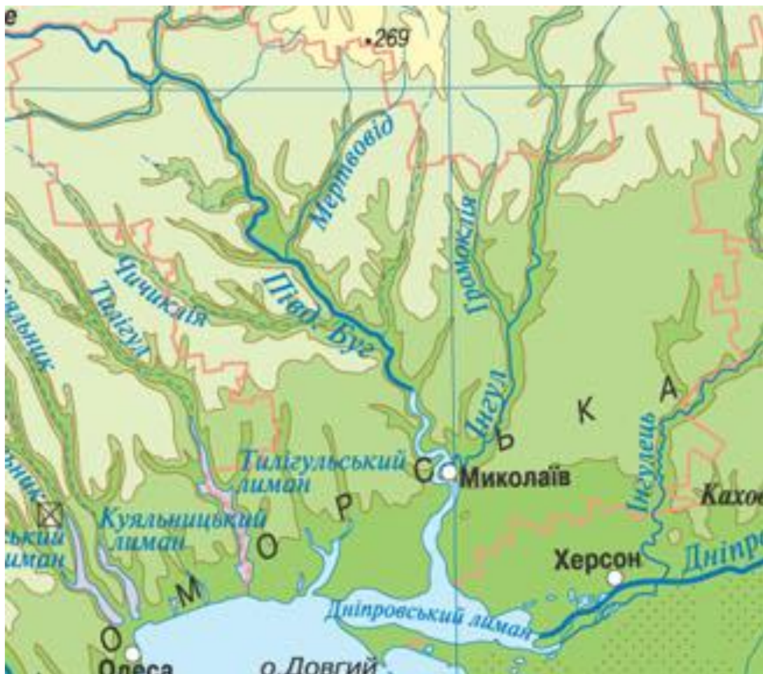
Рисунок 2.2 - Фізична карта Миколаївської області

Кількість адміністративно-територіальних одиниць (районів) – 4 (Миколаївський, Вознесенський, Баштанський, Первомайський). Обласний центр – місто-герой Миколаїв. Чисельність наявного населення (за оцінкою) на 01.01.2022 – 1091,821 тис. осіб.