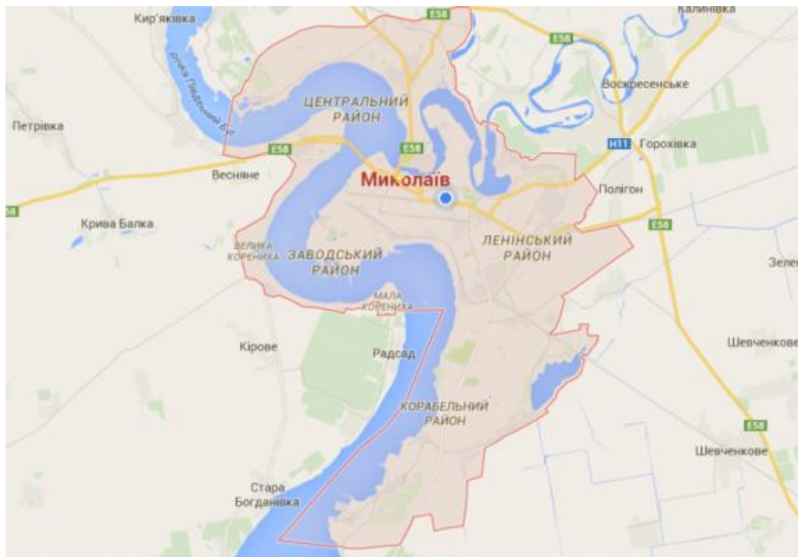
Рисунок 2.1 – карта міста Миколаїв

Місто Миколаїв - місто в Україні, обласний центр Миколаївської області, центр Вітовського і Миколаївського районів. Миколаїв розташований в Північному Причорномор'ї в гирлі річки Інгул, де вона впадає до Південного Бугу, за 65 кілометрів від Чорного моря. Це потужний політичний, діловий, індустріальний, науково-технічний, транспортний та культурний центр. Площа міста за даними головного управління статистики в Миколаївській області станом на складає 259,8 км 2 .