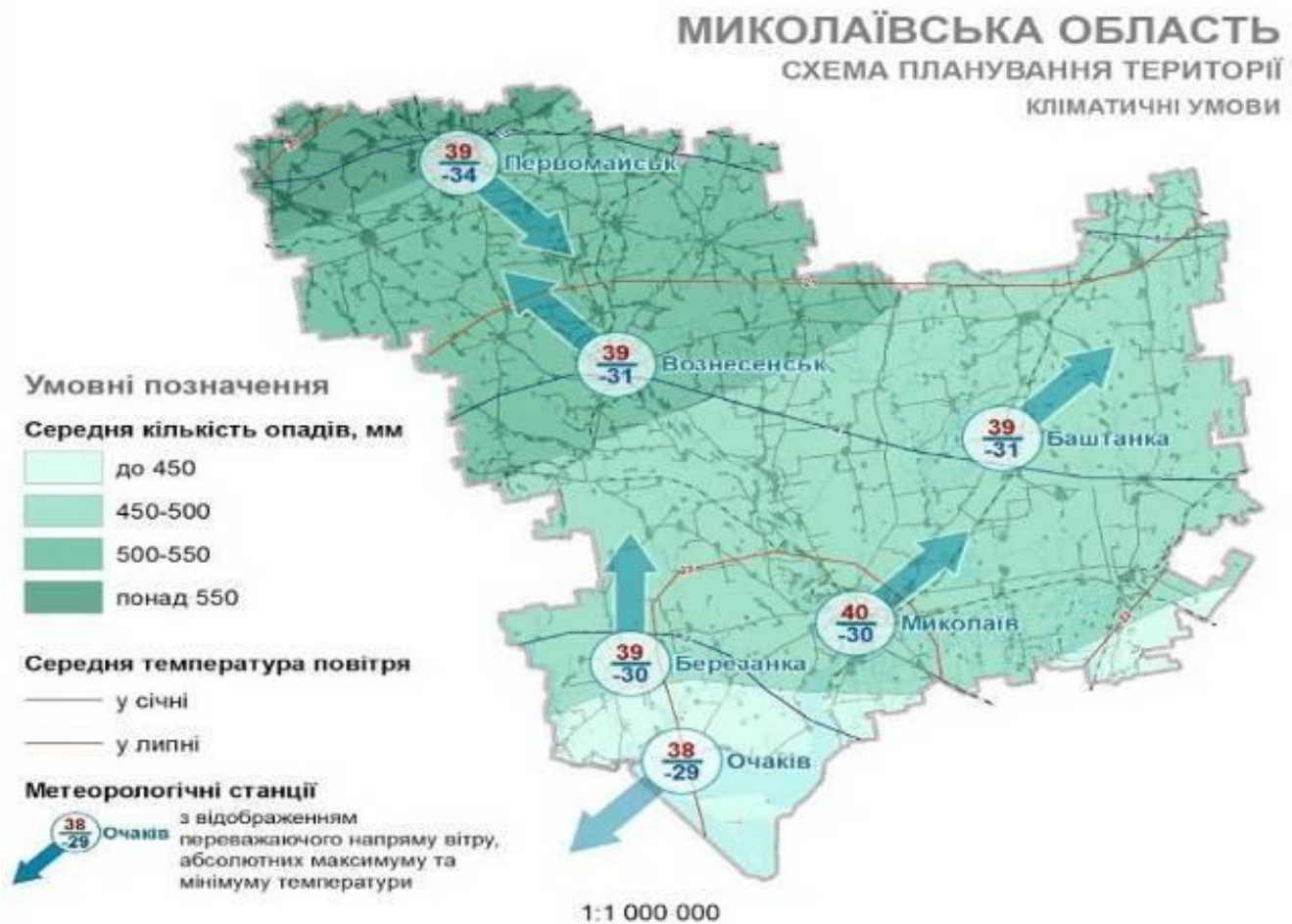
Рисунок 2.3 – Кліматичні умови Миколаївської області Переважаючі напрями вітрів у місті Миколаєві є північно-східні.