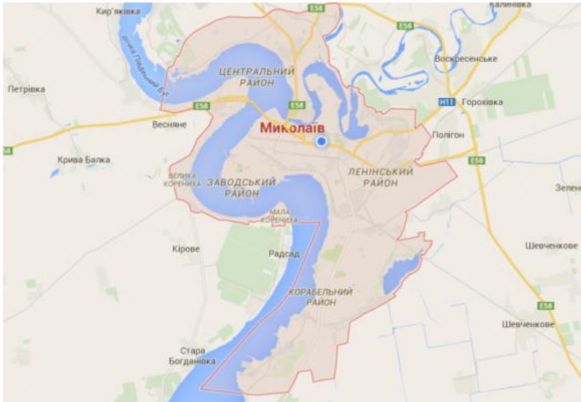
Рисунок 2.1 – карта міста Миколаїв

Місто Миколаїв - місто в Україні, обласний центр Миколаївської області, центр Вітовського і Миколаївського районів. Миколаїв розташований в Північному Причорномор'ї в гирлі річки Інгул, де вона впадає до Південного Бугу, за 65 кілометрів від Чорного моря. Це потужний політичний, діловий, індустріальний, науково-технічний, транспортний та культурний центр. Площа міста за даними головного управління статистики в Миколаївській області станом на складає 259,8 км 2 .