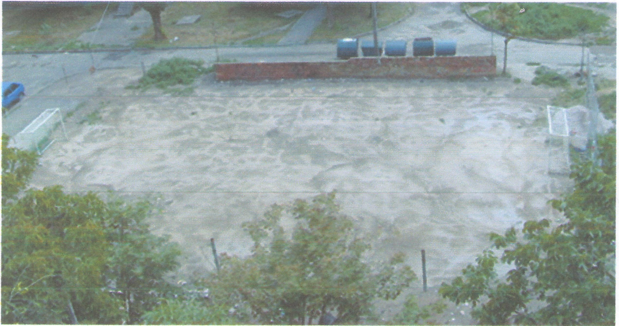
А це сучасний вигляд футбольного ґрунтового поля. Є ворота і сітка рабица навкруги.