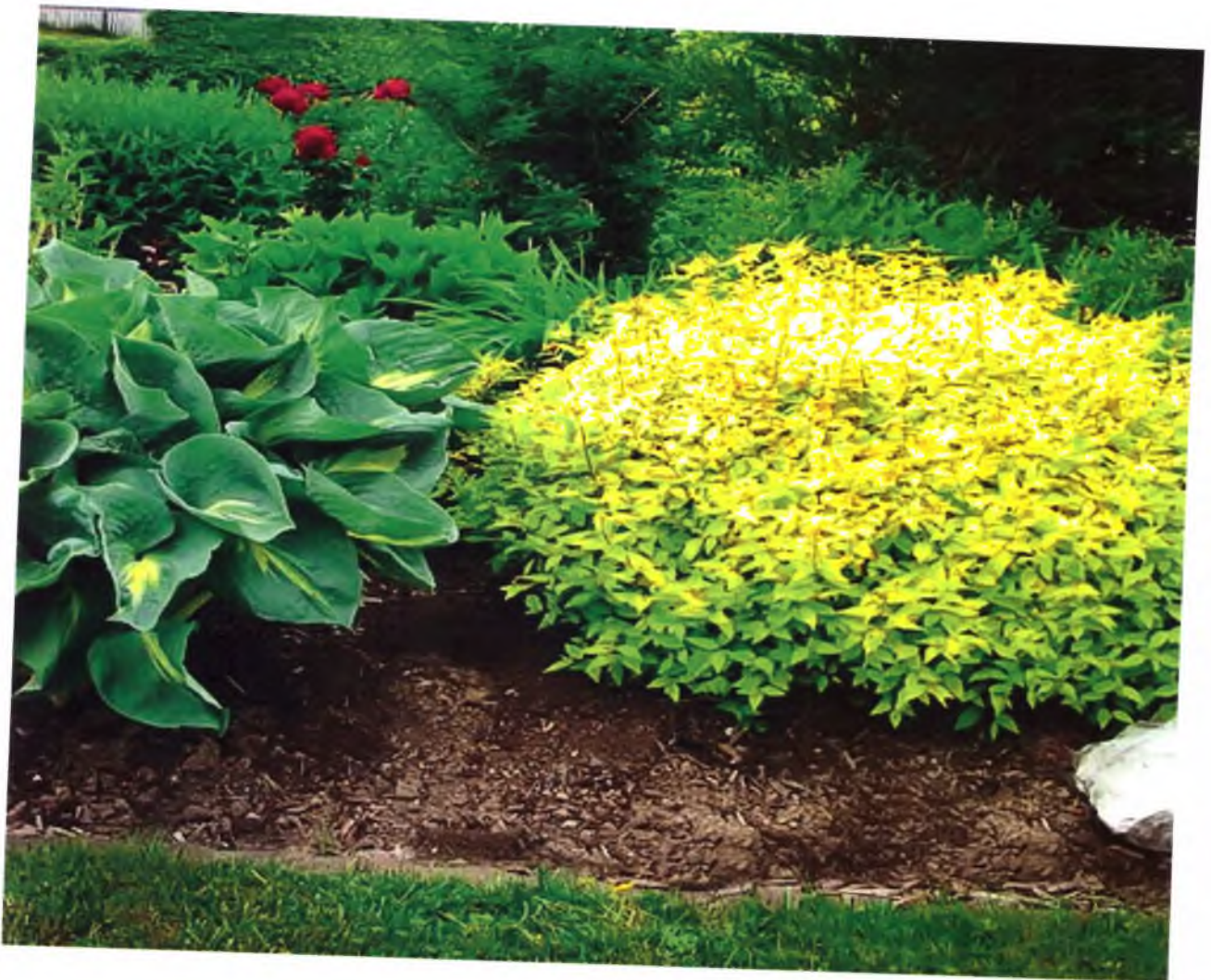
◆ Спірея Голдфлейм