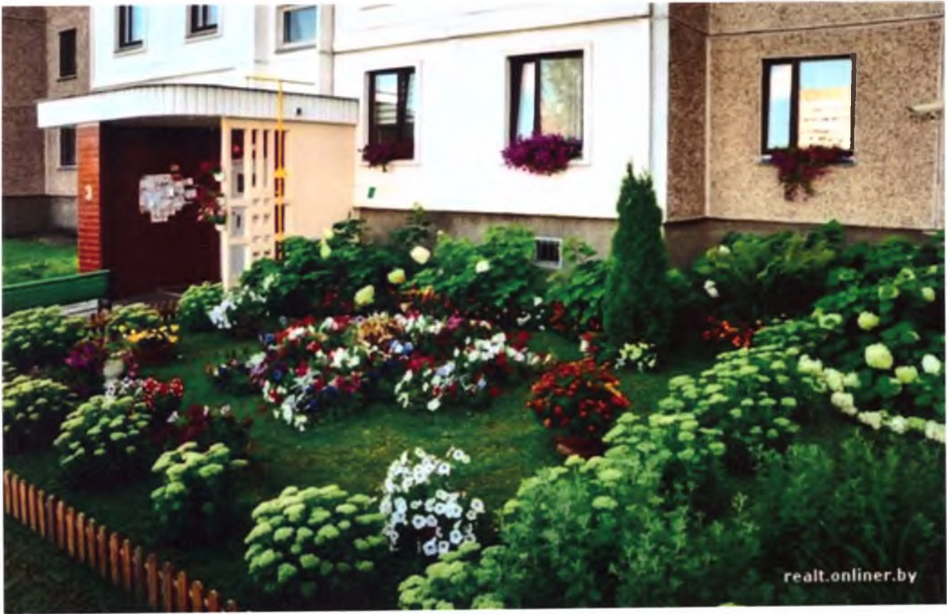
Клумби на прибудинковій території