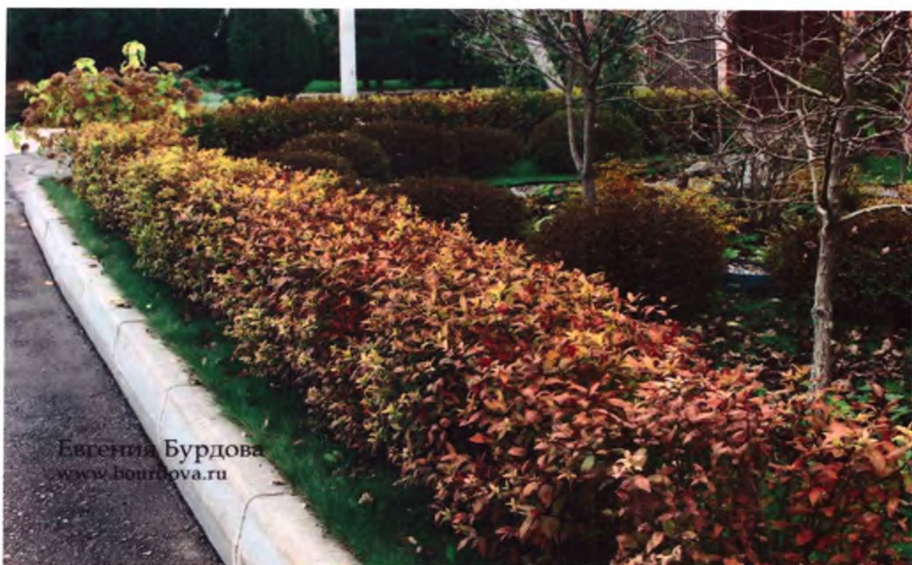
Спірея у ландшафті