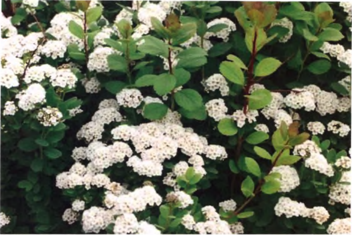
◆ Спірея березолиста