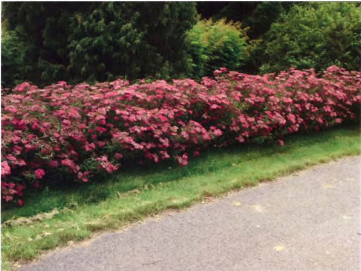
◆ Спірея у живій огорожі