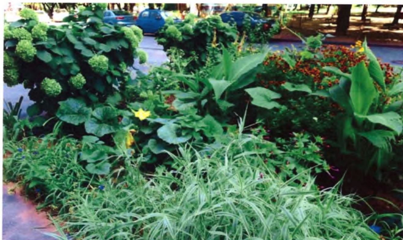
Композиції у дизайні