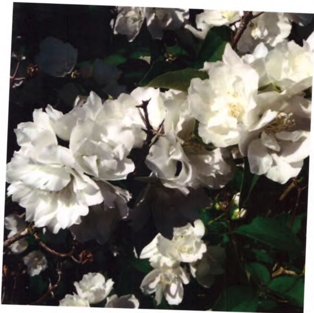
Жасмин Букет Бланк (Чубушник)