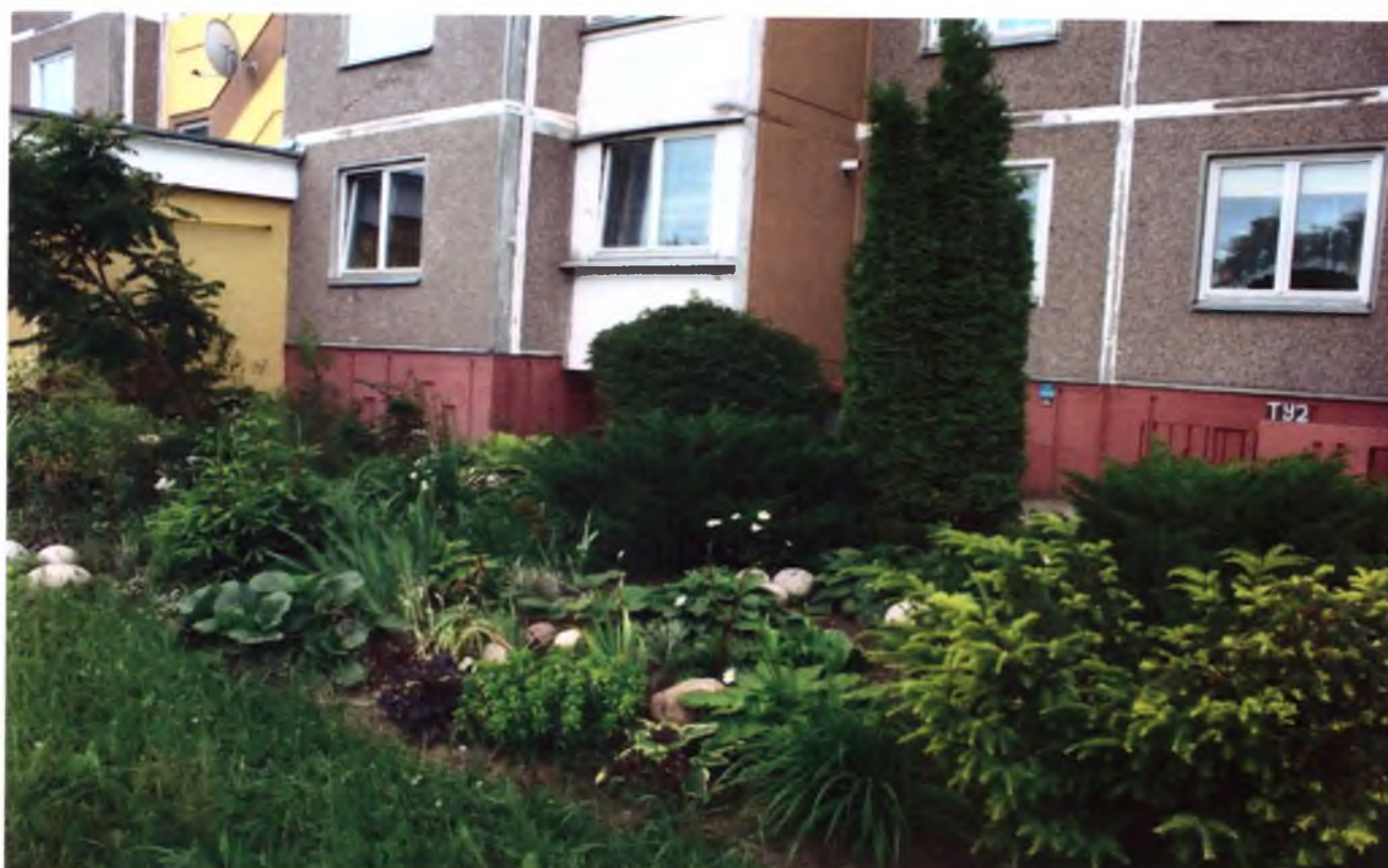
Дерева і кущі спіреї японської в ландшафтному дизайні