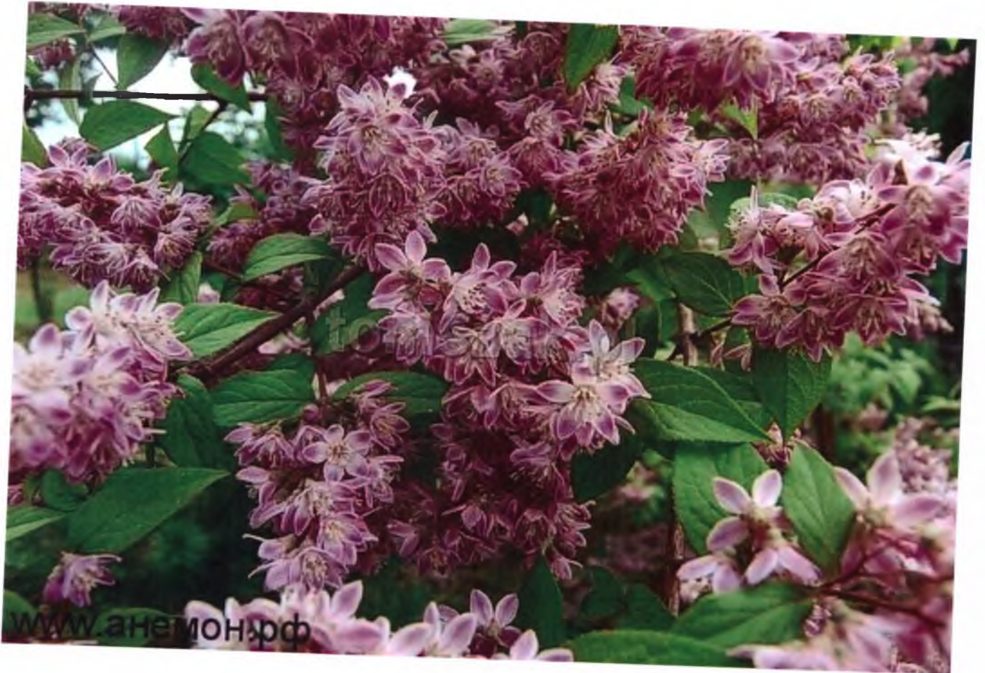
Дейция Стробиерри Филдс