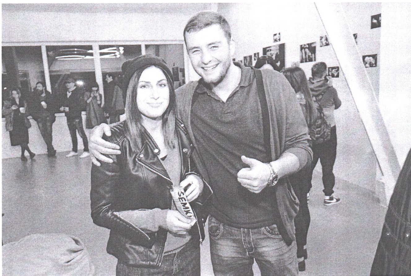
Фотовиставка «Behind the Scenes» Сергія Мельніченко у м. Миколаєві