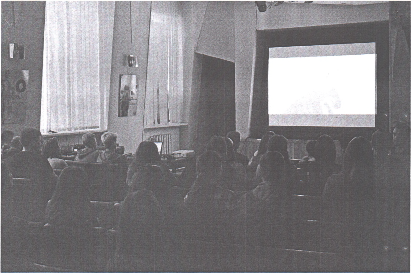
Показ анімаційних фільмів міжнародного конкурсу Linoleum-2018 у м. Миколаєві