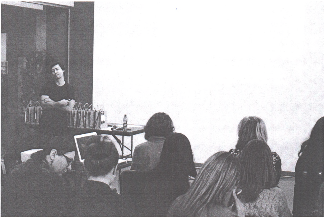
Форум «Місто як культурний феномен» у м. Миколаєві