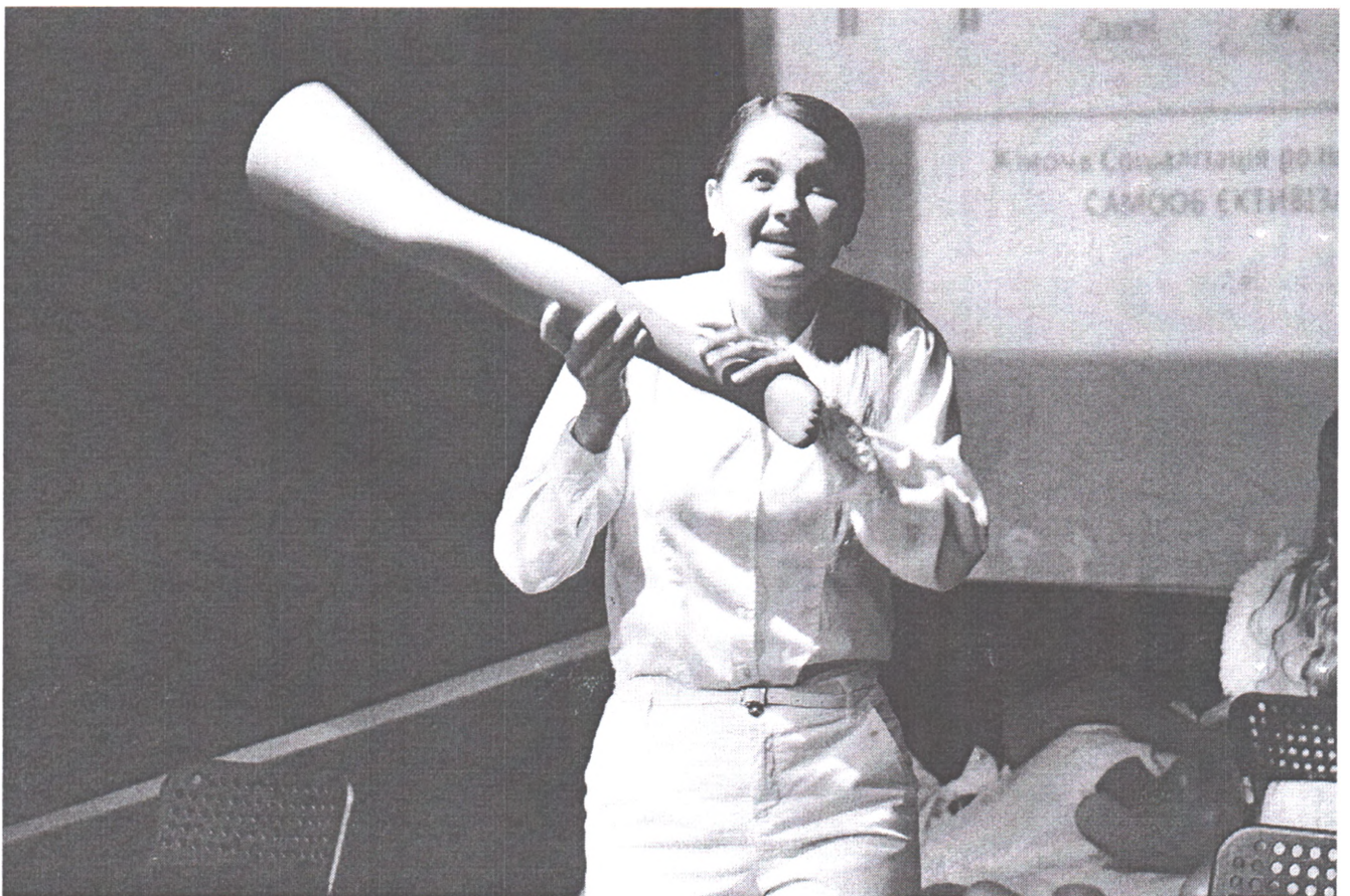
Вистава «Бути знизу» Дикого Театру (м. Київ) у м. Миколаєві