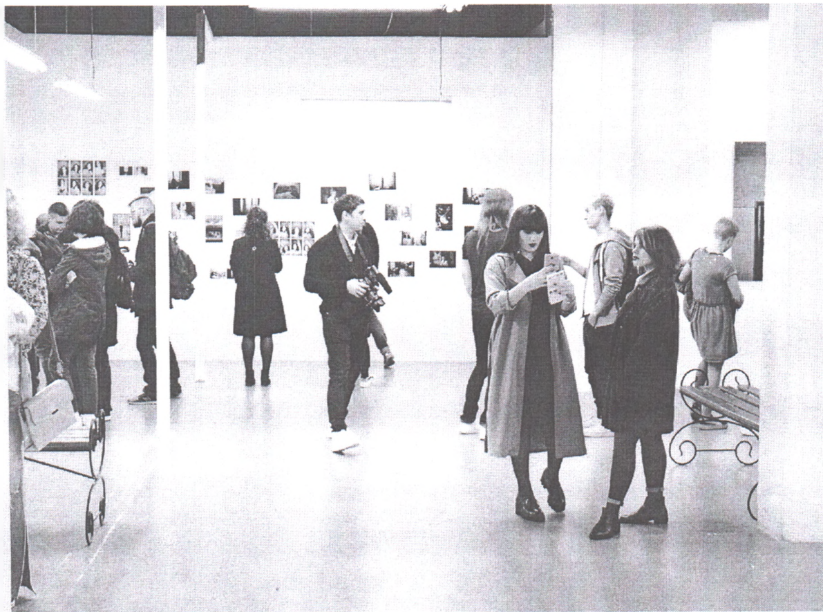
Міжнародна фотовиставка «People Places Processes» у м. Миколаєві