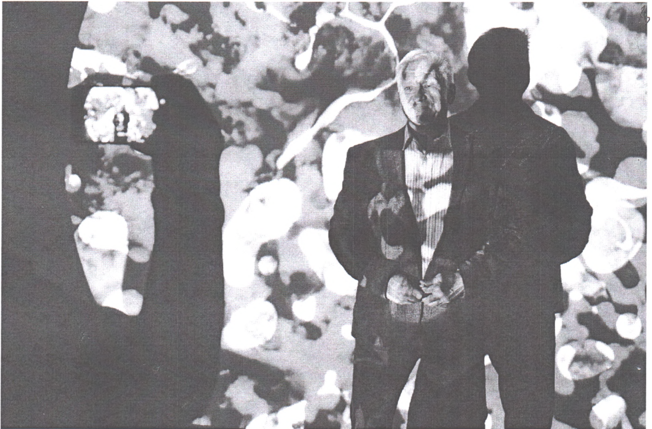
Відкриття виставки фотопроєкту «Роет» в підземному паркінгу у м. Миколаєві