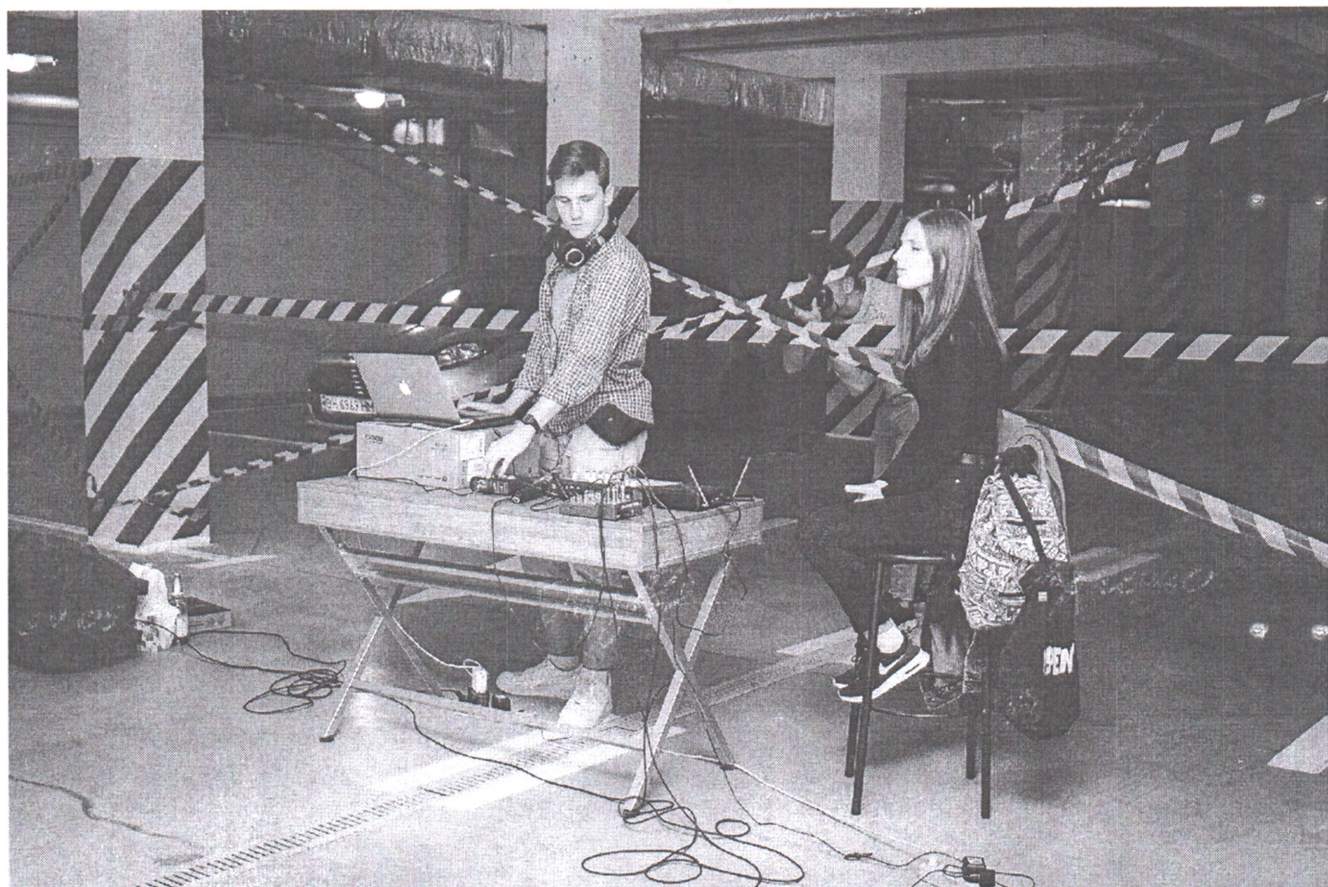
Відкриття виставки фотопроєкту «Роет» в підземному паркінгу у м. Миколаєві