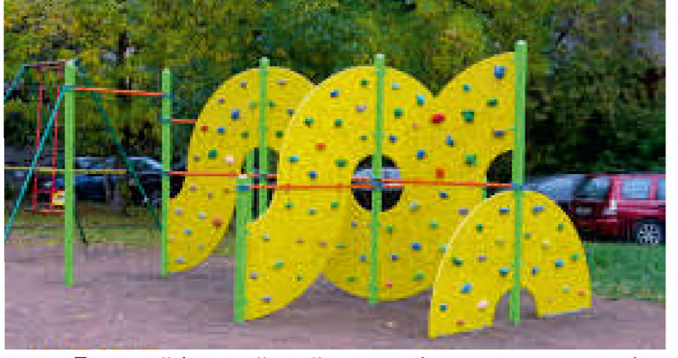
Дитячий ігровий майданчик (типу скалодрому)