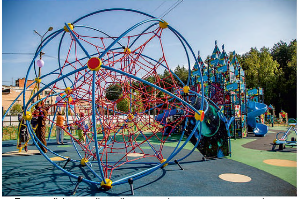
Дитячий ігровий майданчик (типу скалодрому)