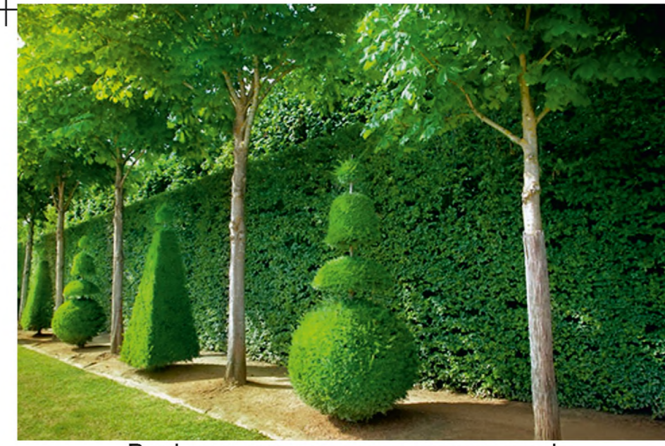
Варіанти скульптур з дерев та кущів