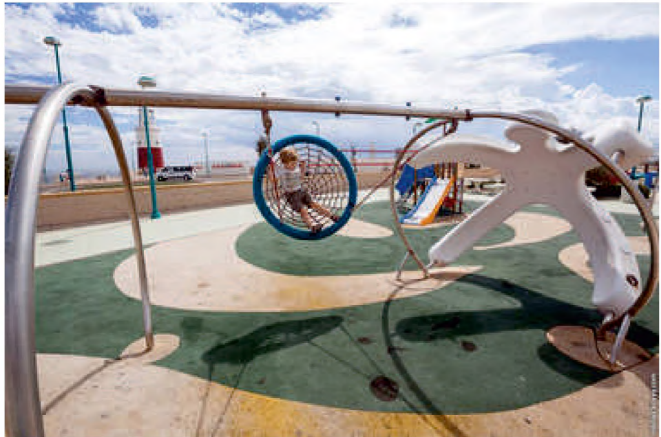
Дитячий ігровий майданчик (типу мотузкового парку)