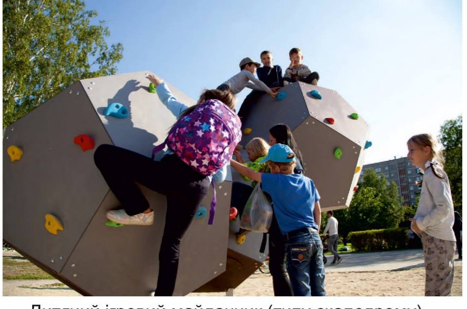
Дитячий ігровий майданчик (типу скалодрому)