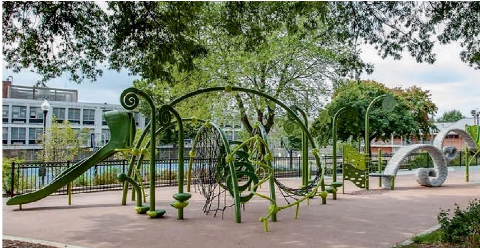
Дитячий ігровий майданчик (універсального типу)