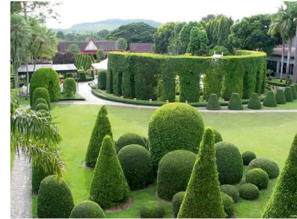
Варіанти скульптур з дерев та кущів