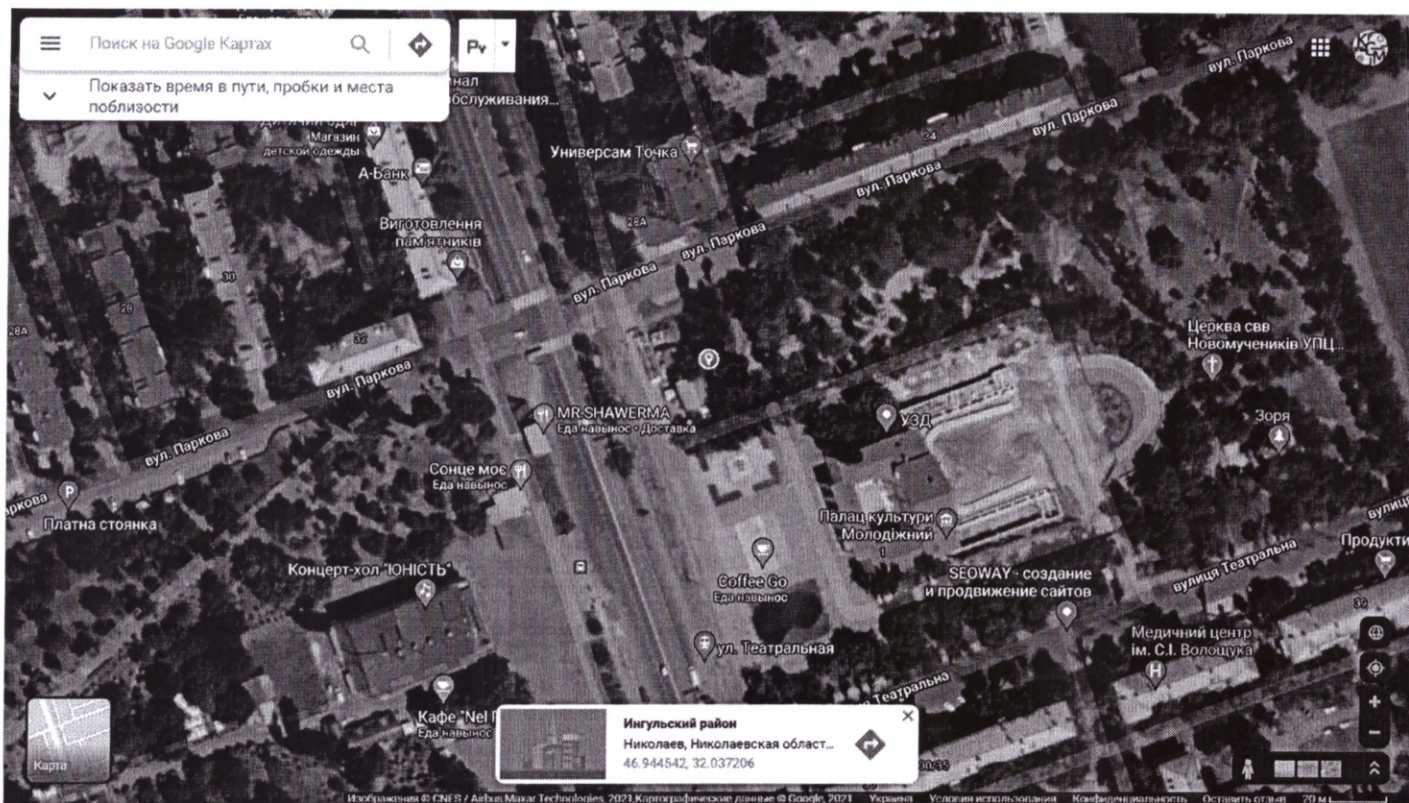
Мапа з зазначеним місцем реалізації проекту