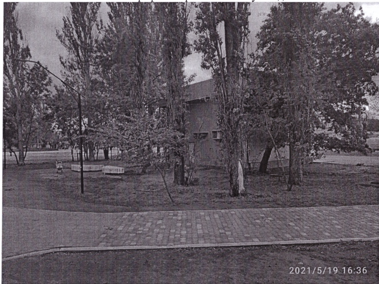
Фотографії теперішнього стану майданчика