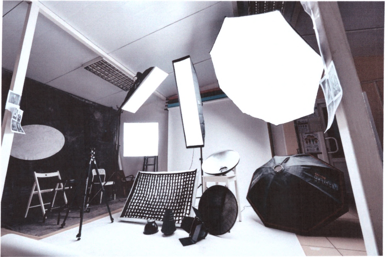
Малюнок дизайну 1

Додаток Б) інші матеріали, суттєві для заявника проекту (орієнтовний дизайн)