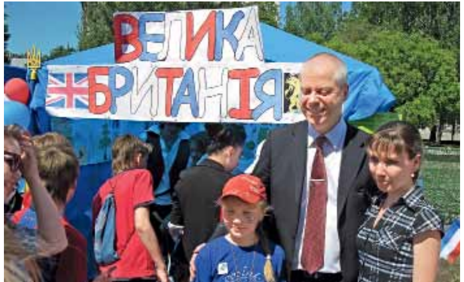
Перший секретар з політичних питань Посольства Великої Британії Данкан Алан з юними гостями свята

– У нас в області 80 Євроклубів. У результаті конкурсу 29 із них отримали право взяти участь у Дні Європи. Після цього шляхом жеребкування між ними розподілили країни. До Дня Європи вони наполегливо готувалися протягом трьох місяців, розробляли „інтер’єр” наметів країн-членів ЄС. Обов’язковою вимогою була наявність якоїсь цікавої інформації про державу. Діти повинні були добре вивчити країну, яку представляли, знати її традиції, історію, географію, кухню тощо. Національні костюми також готували самі.