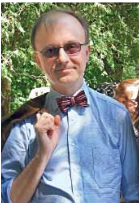
Посол Фінляндії Крістер Міккелсон – „ветеран“ Днів Європи в Україні, нинішні святкування стали для нього вже четвертими.

Нині суднобудування переживає нелегкі часи. Тож перед містом гостро постало завдання переорієнтування економіки та залучення інвестицій для розвитку інших галузей.